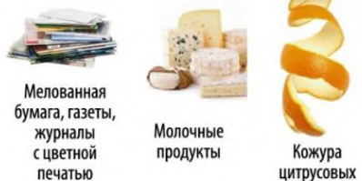
Мелованная бумага, газеты, журналы с цветной печатью