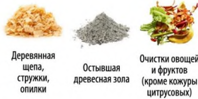
Деревянная щепа, стружки, опилки