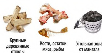
Крупные деревянные отходы