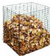
Самодельный компостер из проволоки