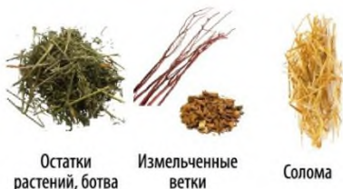
Остатки растений, ботва