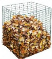
Самодельный компостер из проволоки