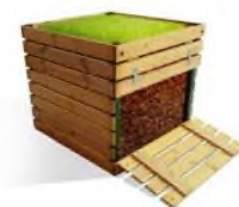
Самодельный деревянный компостер

Компостер можно приобрести готовый, а можно сделать самому