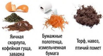
Яичная скорлупа, кофейная гуща, заварка