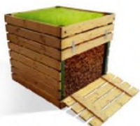
Самодельный деревянный компостер

Компостер можно приобрести готовый, а можно сделать самому